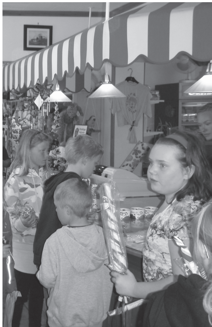
Självklart måste man köpa polkagrisar i Gränna.