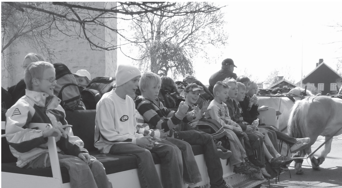
Barnen är laddade för att åka remmalag.