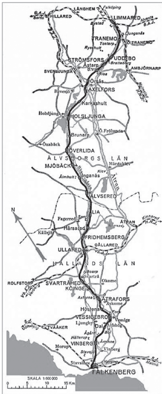
Karta över Falkenbergs järnväg